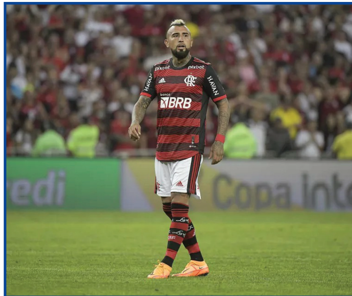
Chileno fez carreira na Europa

Em 2006, Vidal teve a chance de conquistar seu primeiro título continental, mas o Colo Colo falhou na decisão da Sul-Americana, contra o Pachuca. Com duas Copas América no currículo,