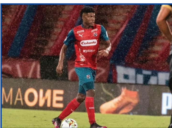
Jogador desembarca semana que vem para assinar contrato de três anos