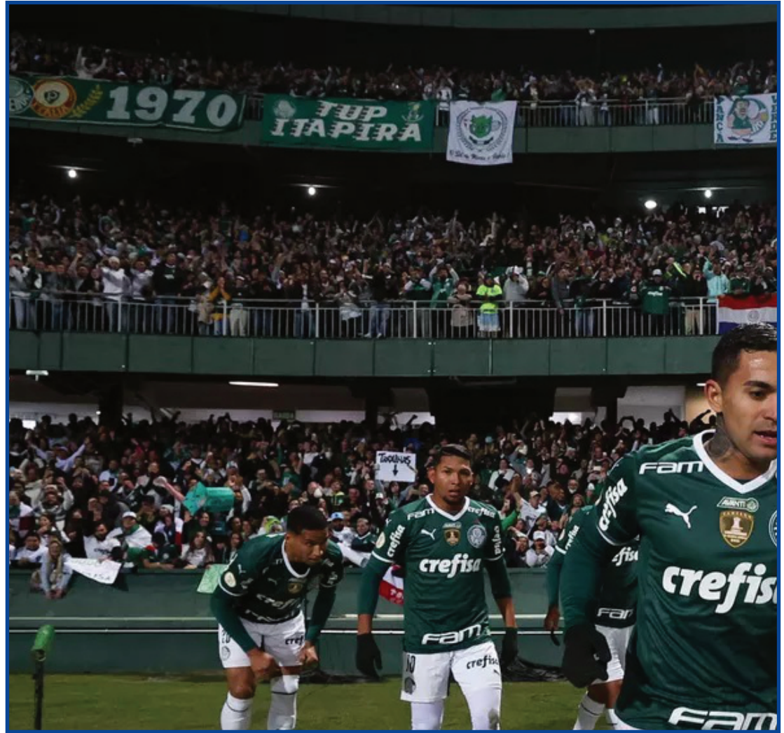
Palmeiras comemora gol contra o Coritiba

Depois de priorizar a preparação do grupo para competições no início da temporada, casos do Mundial de Clubes da Fifa e da Recopa