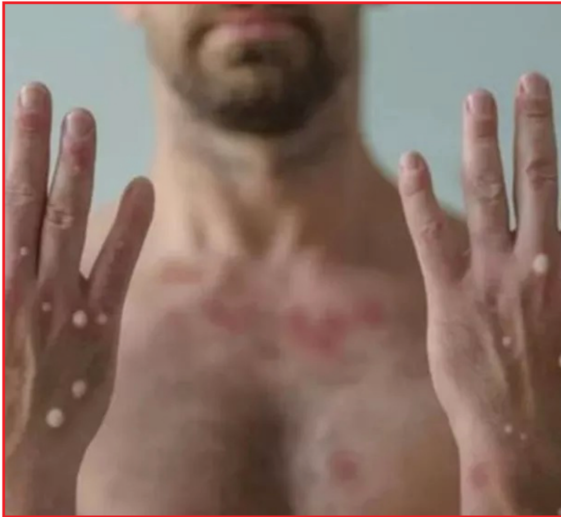
Dois casos da varíola dos macacos estão sendo investigados em Cuiabá

Nas duas situações, os pacientes realizaram viagens a cidades da região Sudeste do país em prazo de 21 dias anteriores ao início dos sintomas.