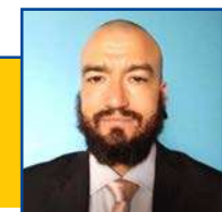
POR LEANDRO CARECA

Covardia. A PM apreendeu na quarta (10) a arma de um homem que ameaçou e agrediu a vizinha dele, em Sinop. Conforme a polícia, a mulher registrou um BO após o suspeito bater nela em frente de casa. A agressão aconteceu no dia 29 de julho. Câmeras de segurança da casa da vítima mostram o momento em que uma caminhonete estaciona na rua, próximo à casa dela. Logo depois, o suspeito sai correndo do carro e empurra a mulher, que cai no chão. O suspeito entra no veículo e foge. Conforme o BO, o suspeito já foi vizinho dela por dois anos e os desentendimentos começaram por discordarem sobre a divisa do terreno dos imóveis. A vítima informou à polícia que já foi agredida outras duas vezes pelo suspeito. Segundo a mulher, o homem também já a havia ameaçado com uma arma de fogo. O suspeito, que não teve a identidade divulgada, perdeu a autorização de posse e a PM apreendeu também 33 munições.