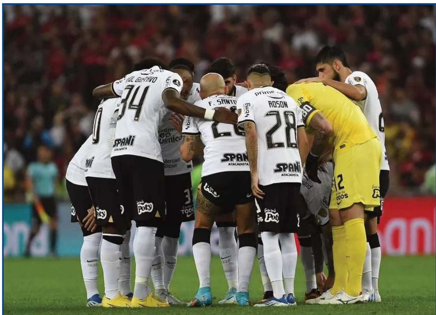
Jogadores do Corinthians no duelo contra o Flamengo