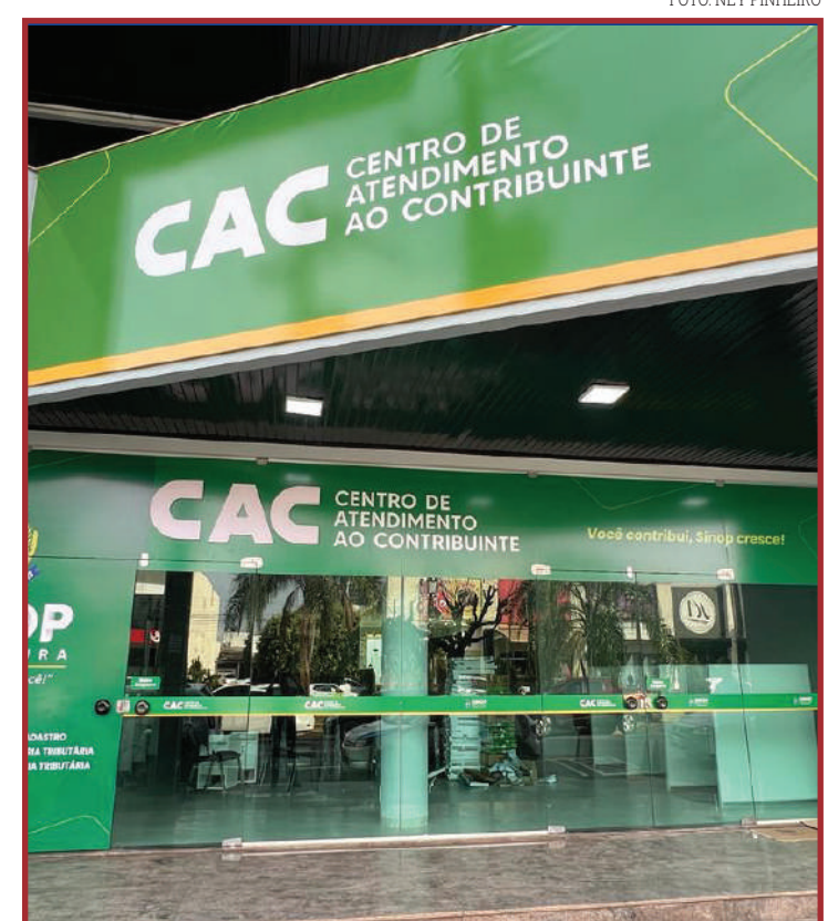
os contribuintes a partir de segunda serão recebidos no novo espaço