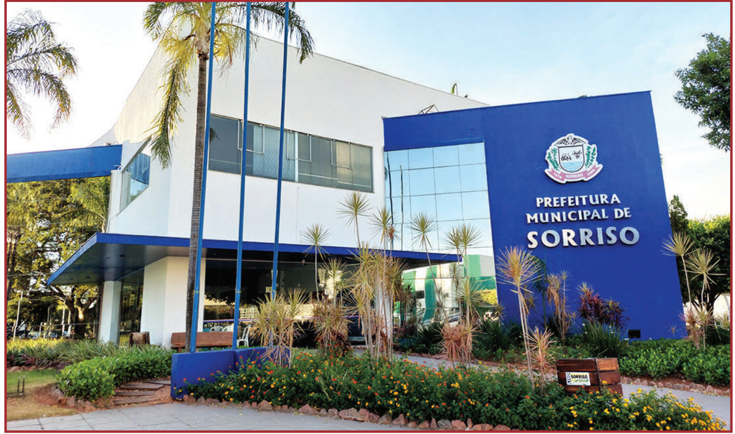
O MPMT pleiteia ainda o pagamento de indenização pelo dano moral coletivo

O esquema foi viabilizado por meio da celebração do contrato nº 075/2019, decorrente do procedimento licitatório Pregão Presencial nº 143/2018, destinado à contratação de prestadora de serviços de mão de obra de