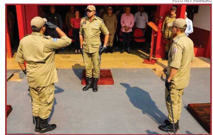
Solenidade marcou passagem de comando