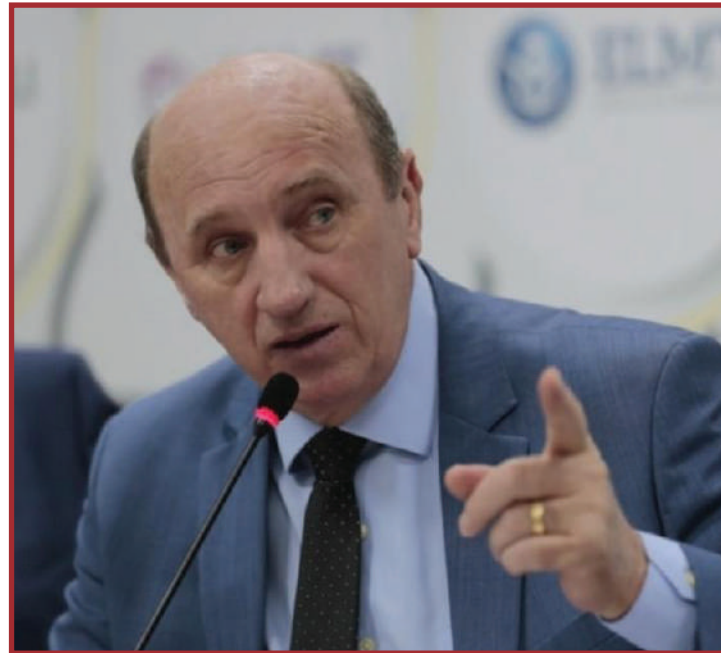
Placar atual está 3 a 1 contra Neri Geller