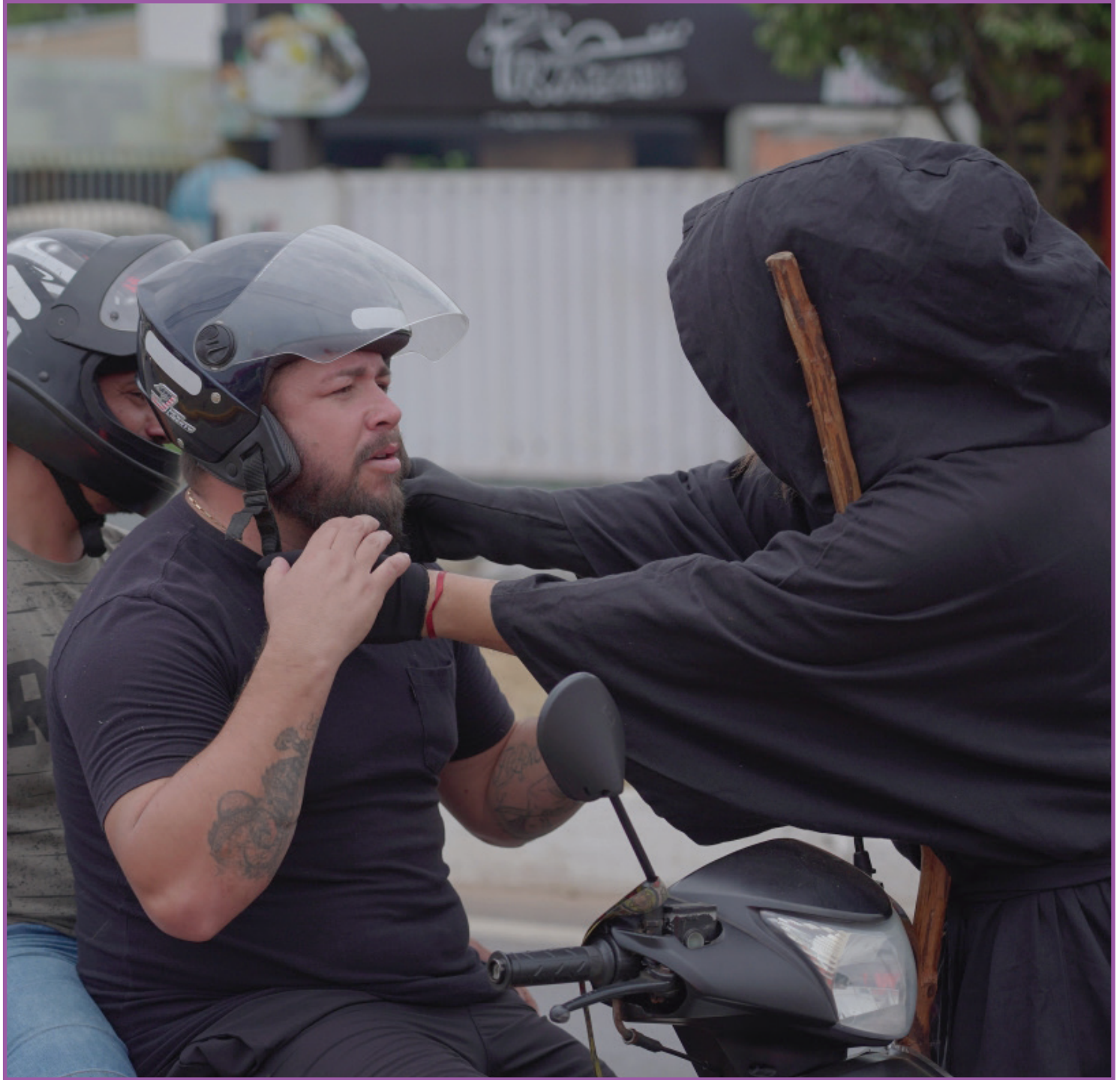
Acidentes geram custos na saúde