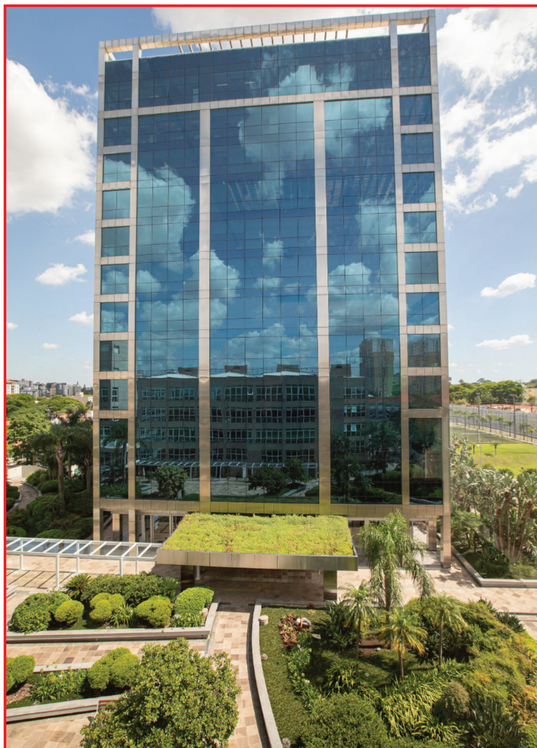
Estrutura foi recertificada pela LEED recebeu 88 pontos, melhor nota do país para operação e manutenção

Conquistada pela primeira vez em 2016, a certificação LEED tem validade de cinco anos e incentiva práticas sustentáveis nas edificações, avaliando os seguintes aspectos: Processo Integrado, Localização e Transporte, Lotes Sustentáveis, Eficiência da Água, Energia e Atmosfera, Materiais e Recursos, Qualidade Interna dos Ambientes, Inovação e Prioridades Regionais.