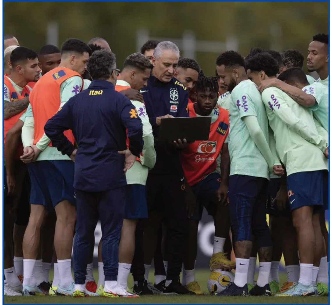
Tite orientando jogadores da Seleção

O desempenho de Richarlison e a retomada em mais alto nível de Gabriel Jesus deixa a formação sem centroavante, na qual Neymar e Paquetá dividem o comando do ataque, com menos força entre as opções preferidas de Tite.