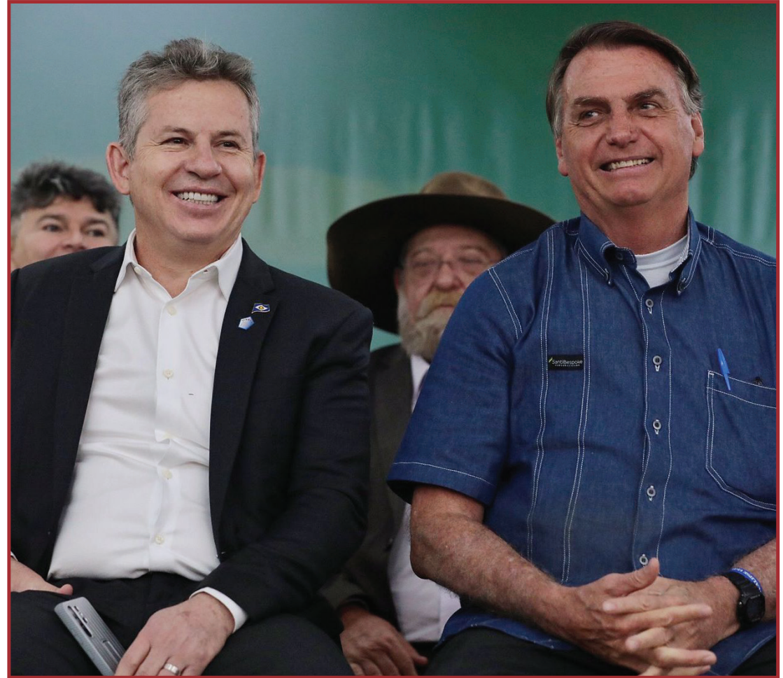
Pesquisa foi divulgada nesta segunda-feira

A candidata Soraya Thronicke (União Brasil), também senadora por Mato Grosso do Sul tem 1% da preferência do eleitorado. Os outros nomes que concorrem à presidência da República não apareceram na pesquisa por terem menos de 1% de intenção de votos. Das mais de mil pessoas entrevistadas, 4% afirmaram que votarão branco ou nulo e outros 8% não souberam responder.