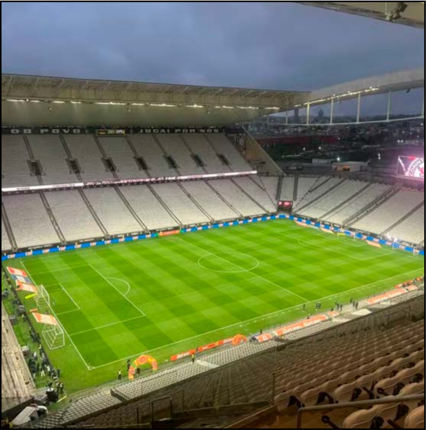
Neo Química Arena antes de Corinthians x Vasco

“Esses fatos são, em tese, graves e demonstram um eventual risco sistêmico financeiro. Referida investigação não se confunde com gestão esportiva ou administrativa do clube, mas incide sobre fluxos financeiros, governança de fundo e eventual infiltração criminosa nesse cenário”, escreveu o representante do MP. O promotor pediu a investigação à PF porque o caso envolve a Caixa, uma instituição federal com utilização de recursos públicos, e possível repercussão interestadual e transnacional das operações financeiras.