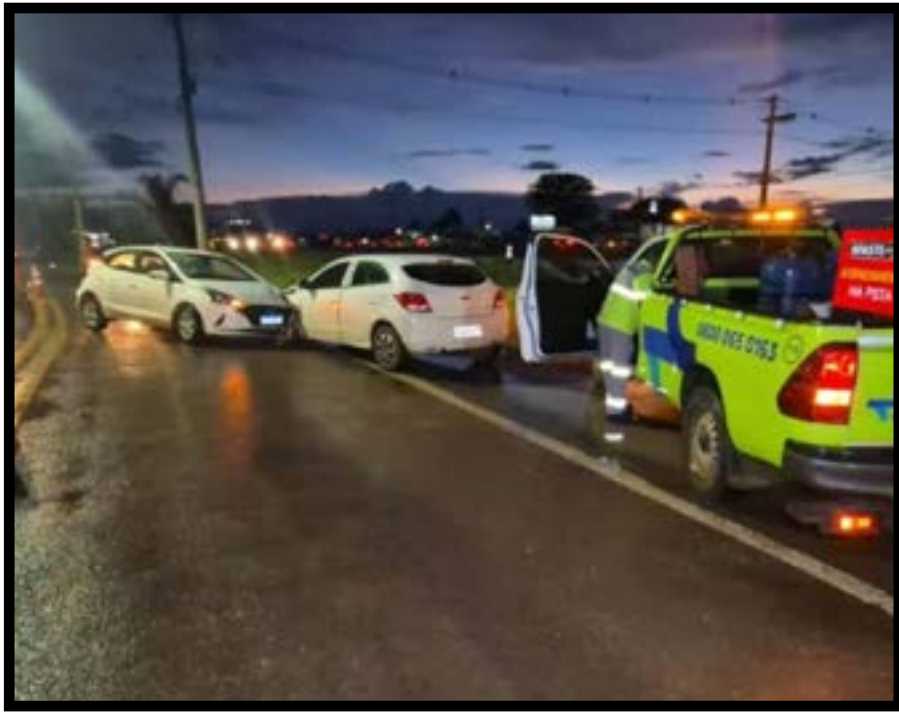
Uma colisão frontal envolvendo dois veículos deixou uma pessoa ferida e causou interdição parcial de uma via em Sinop. A colisão ocorreu na terça (6) nas proximidades do Jardim Safira, na rua João Pedro Moreira de Carvalho, lateral da BR-163. Um GM Onix seguia no sentido centro, enquanto um Hyundai HB20 trafegava na direção oposta. O condutor do Onix relatou que o HB20, que estava atrás de um veículo de carga, teria realizado uma ultrapassagem para acessar a alça da rodovia federal, momento em que ocorreu a colisão frontal entre os dois carros.